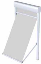
FM 102/202 Schienenführung, mit Ausfalleinheit