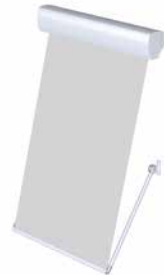
FM 105/205 Fallarmmarkise