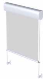
FM 103/203 Seilführung